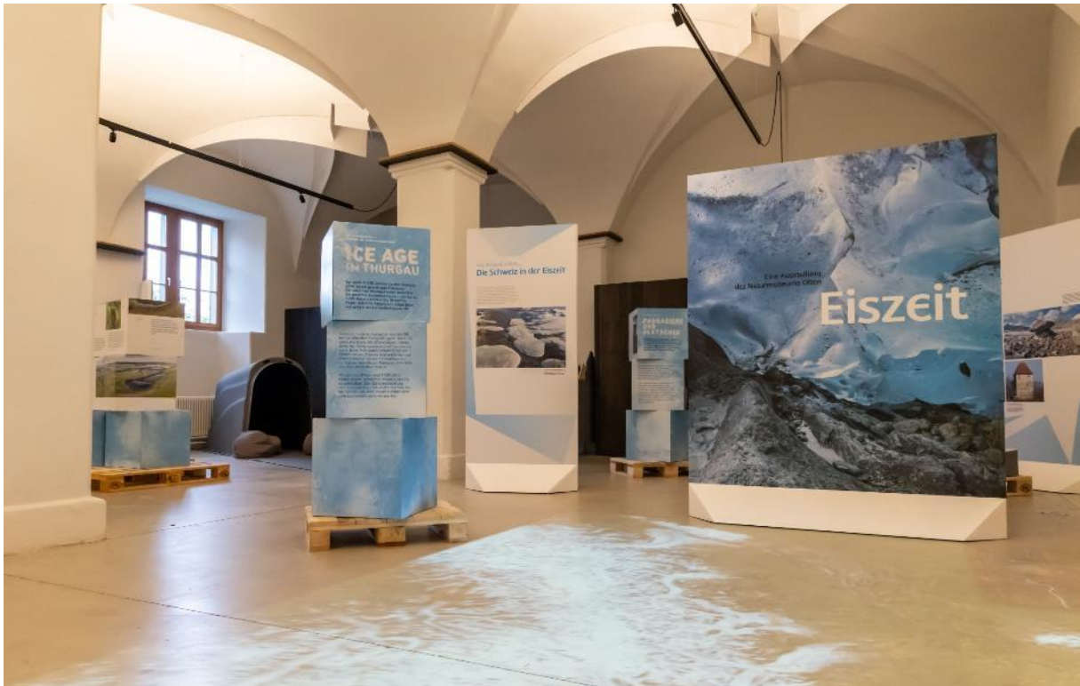
Blick in die Ausstellung, Foto: Seemuseum, Nina Kohler