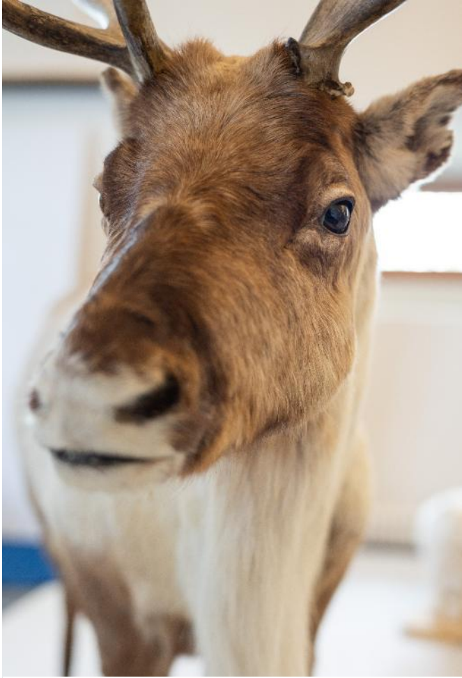
Das Rentier – wichtig für die Wildbeuterguppen der ausgehenden Eiszeit, Foto: Seemuseum, Nina Kohler.